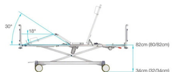
*) 4-function model