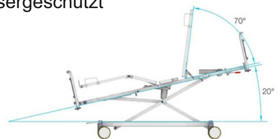
*) 4-function model